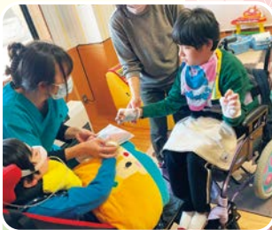
卒業生にプレゼントを渡しました。