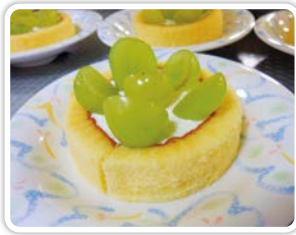
採れたシャインマスカットをケーキにトッピング