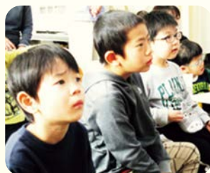
卒園DVDを視聴しながら、花りんごでの思い出を振り返りました。