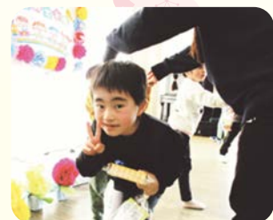
最後は、お友達と職員が作ったトンネルで卒園児を見送りました。