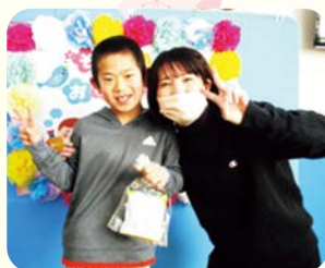
大好きな先生と、笑顔で「はいっ!ポーズ!!」