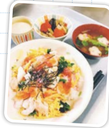
3月 ひなまつりちらし