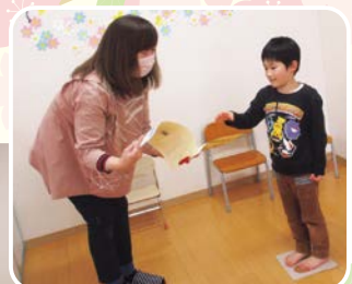
スタッフから、はあとでの思い出が沢山詰まったアルバムが手渡されました♡