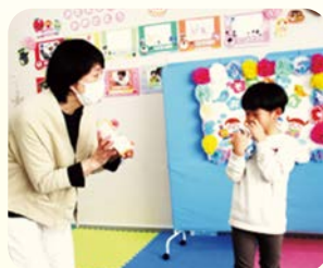
職員からのお祝いの言葉に、思わずウルッとする場面もありました。